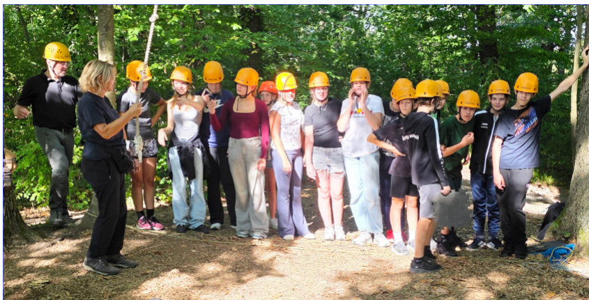
Ausflug in den Kletterpark