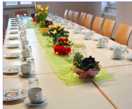
Senioren-Kaffee im Februar