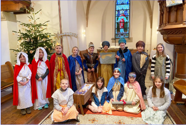
An Heiligabend führten die Kinder das Krippenspiel „Unterwegs zum Stern von Bethlehem“ auf.

In unserem Familiengottesdienst an Heiligabend führten die Krippenspielkinder das Stück „Unterwegs zum Stern von Bethlehem“ auf. Neben den Sterndeutern und zwei Sterndeuterkindern spielte auch der böse König Herodes eine Hauptrolle. 15 Kinder von Klasse 1-6 wirkten in diesem Jahr beim Krippenspiel mit – und einige von ihnen hatten auch recht viel Text auswendig zu lernen. Sie alle machten ihre Sache super und bekamen viel Lob und Applaus. Festlich umrahmt wurde der Gottesdienst von den Bläsern des Musikvereins sowie von Orgelmusik, Epiano, Gitarre und Cajon.