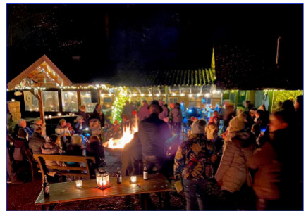
Waldweihnacht in stimmungsvollem Ambiente an der Saatschule

Am Freitag vor dem 3. Advent war Waldweihnacht an der Saatschule. Die Andacht mit Weihnachtsgeschichten, einem Impuls und vielen schönen Weihnachtsliedern lud dazu ein, neu über die Bedeutung von Weihnachten für uns nachzudenken. Musikalisch wurde die Feier von den Bläsern des Musikvereins gestaltet, die Jäger übernahmen wieder die Bewirtung und hatten im Vorfeld schon alles stimmungsvoll dekoriert.