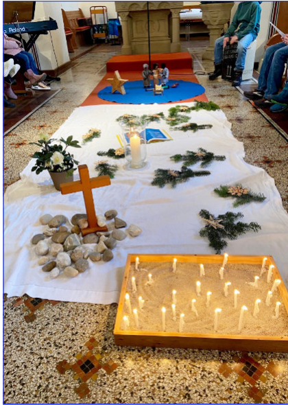
Familienkirche am 2. Advent

Am 2. Advent feierten wir wieder „ Familienkirche “ – einen Gottesdienst für Kinder und Erwachsene zum Mitmachen, Schauen und Erleben. Die Geschichte der Sterndeu-