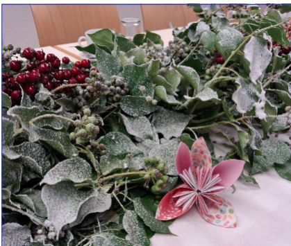
„Verschneite“ Tischdeko im Januar