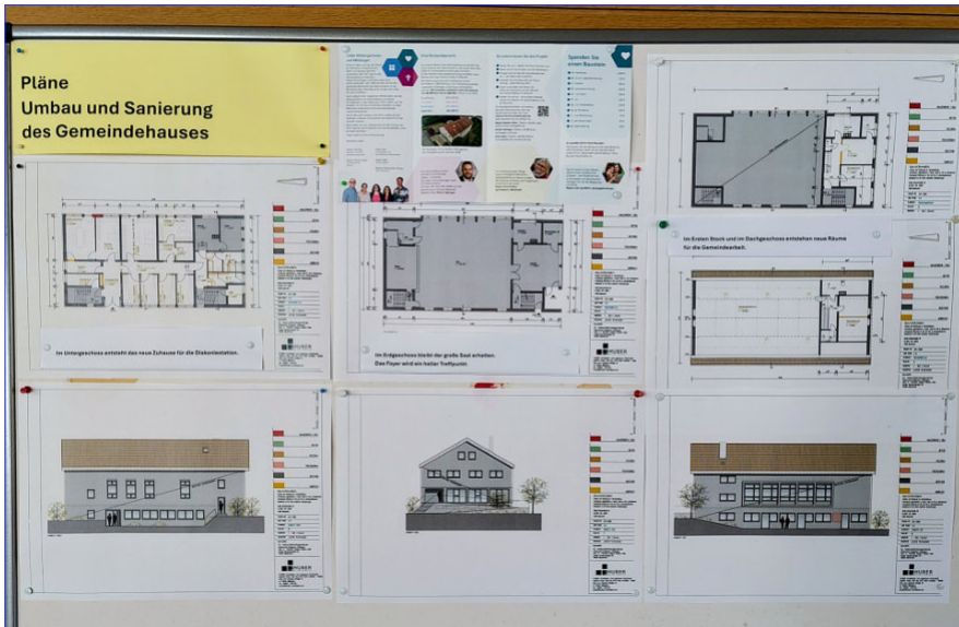
Stellwand im Foyer des Gemeindehauses. Hier kann man die Baupläne sehen.

macht. Wenn alles läuft wie geplant, können noch im Frühjahr die Ausschreibungen erfolgen und nach der Vergabe nach den Sommerferien die Bauarbeiten beginnen.